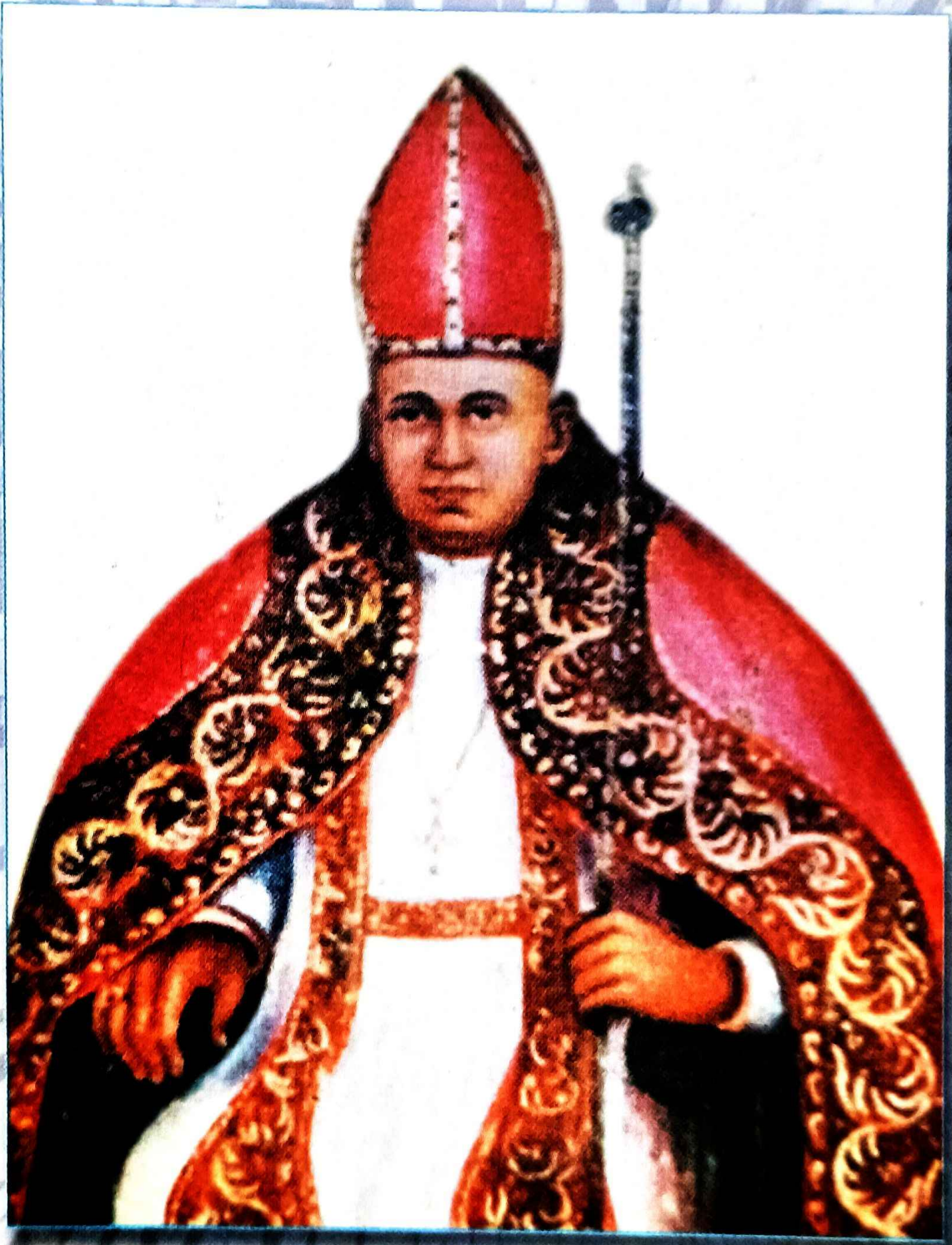
പറമ്പിൽ ചാണ്ടിമെത്രാൻ ഭരണകാലം : 1663-1687 പ്രഥമ സ്വദേശി മെത്രാൻ